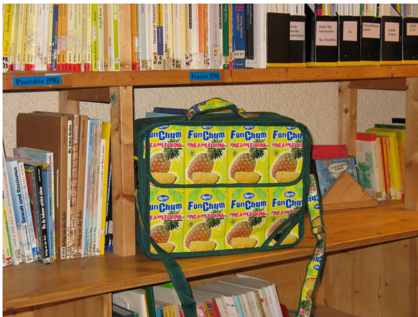
Eine der Lerntaschen in der Bibliothek

Die Lerntaschen sind so konzipiert, dass mit ihrer Hilfe ohne große Vorkenntnisse und Vorarbeiten selbstständig Unterrichtseinheiten zu den entsprechenden Themenkomplexen gestaltet werden können. Die Ausleihe der Lerntaschen kostet 5,- Euro, zusätzlich muss eine Kautions hinterlegt werden.