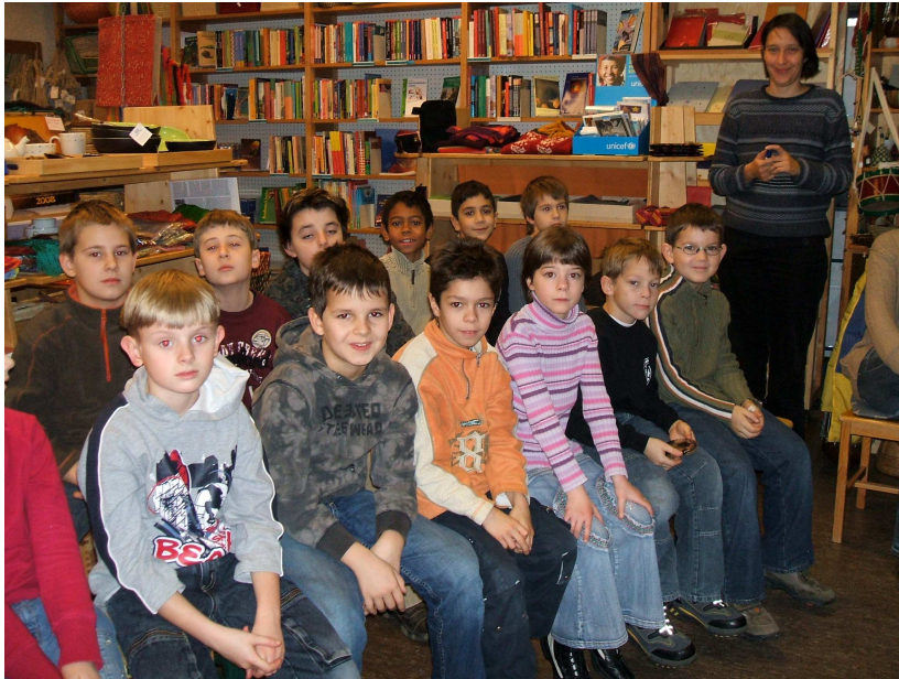
Schüler der Grundschule Rintheim zu Besuch im Weltladen

Umgebung besonders aufnahmefähig und lernbereit sind. Im Einzelfall sind wir aber auch bereit, die Einheiten in den Schulen abzuhalten, wenn es den Lehrern z.B. aus zeitlichen Gründen nicht möglich ist, in den Weltladen zu kommen.